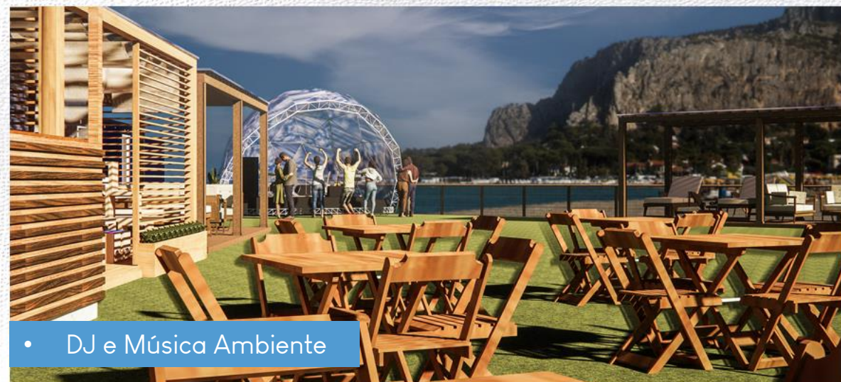
• DJ e Música Ambiente