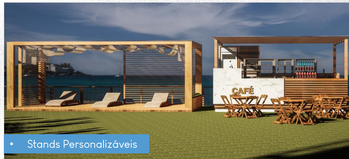
• Stands Personalizáveis