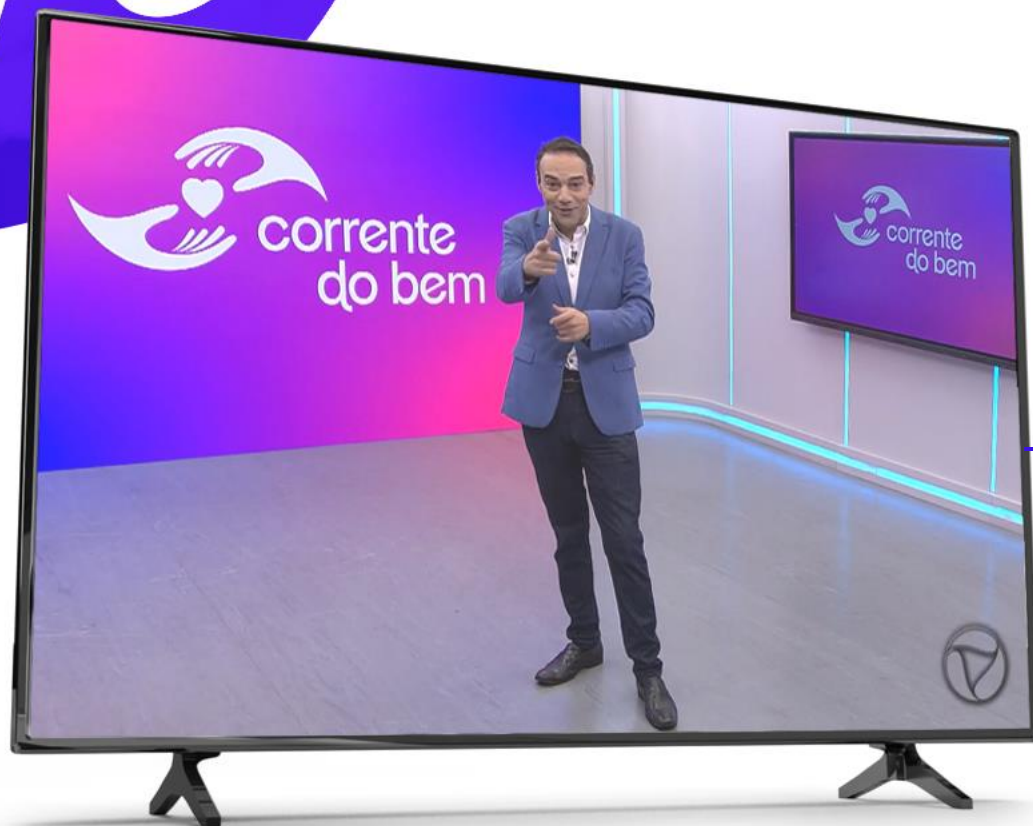
Melhores momentos 1ª temporada 2025

Os 08 episódios contarão com a participação de todas as empresas parceiras , com cada uma delas recebendo destaque em dois dos programas .