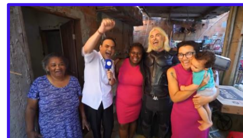
1º episódio 2025