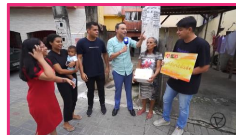
8º episódio 2025

CLIQUE NAS IMAGENS E ASSISTA A ALGUMAS HISTÓRIAS DA 1ª TEMPORADA 2025