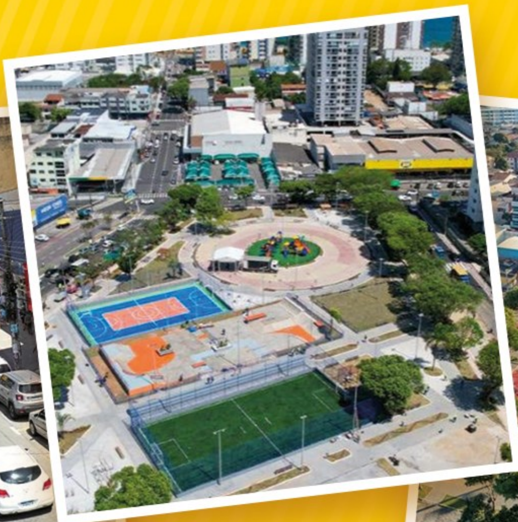
PRAÇA DE COQUEIRAL DE ITAPARICA