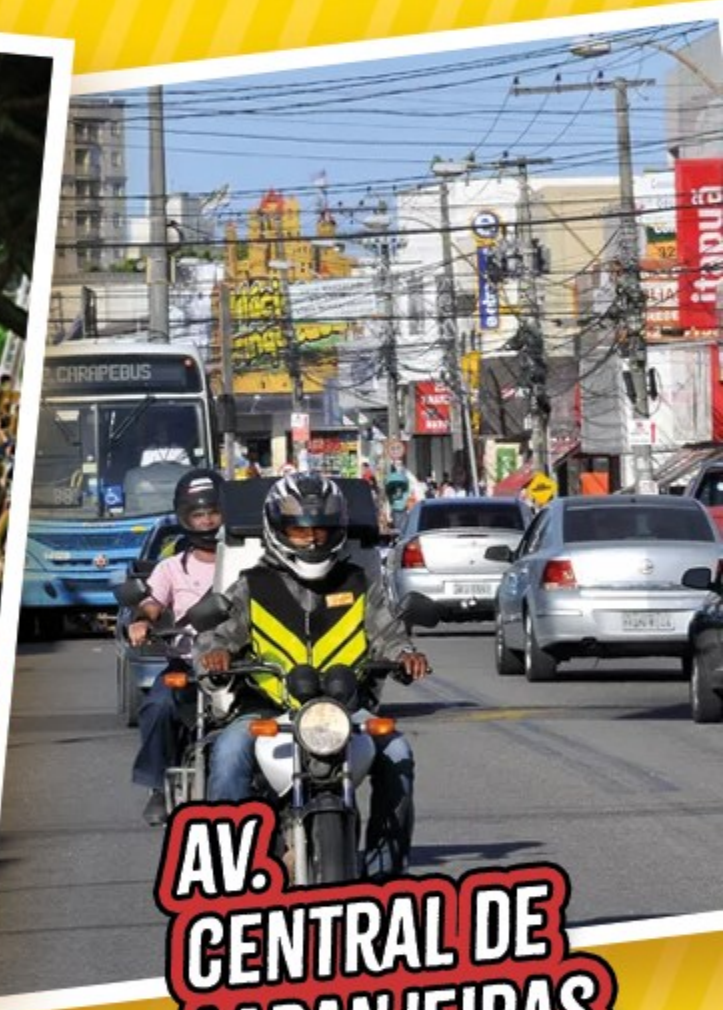
AV. CENTRAL DE LARANJEIRAS