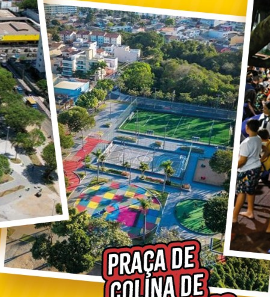
PRAÇA DE COLINA DE LARANJEIRAS