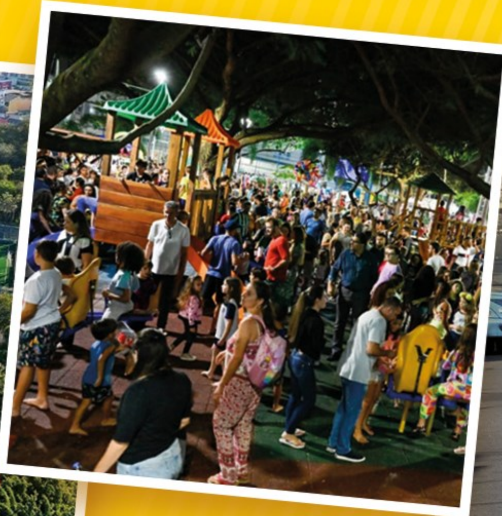
PRAÇA DE JARDIM CAMBURI