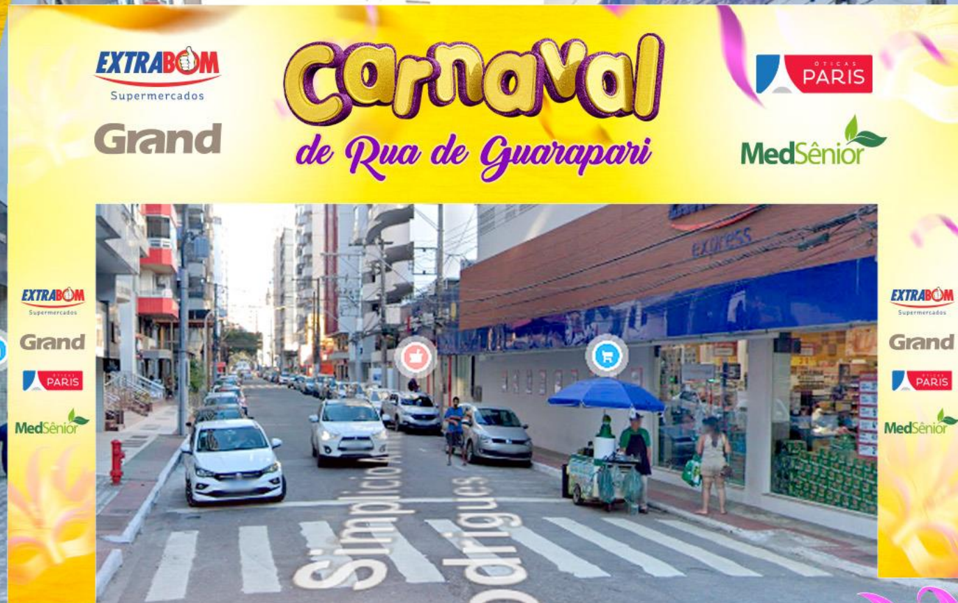
02 Pórticos com aplicação da marca patrocinadora

A sua marca estampada com elegância no pórtico que dá boas-vindas ao público. Cada visitante será recebido por esse espetáculo de visibilidade, onde sua marca se transforma na porta de entrada para uma experiência cheia de emoção.