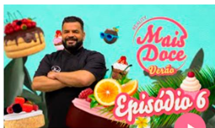
Episódio 2ª temporada Mais Doce