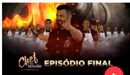
Episódio 3ª temporada Chef de Família